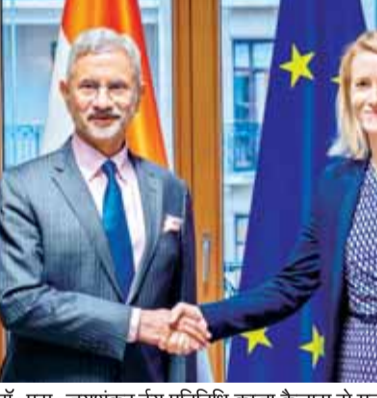
डॉ. एस. जयशंकर ईयू प्रतिनिधि काजा कैलास से मुलाकात करते हुए

विदेश मंत्री ने कहा कि एफटीए द्विपक्षीय संबंधों में एक बड़ा मील का पत्थर होगा। यह भारत-ईयू संबंधों में एक टर्निंग पॉइंट है। यह न सिर्फ इसकी बहुत बड़ी आर्थिक क्षमता को उजागर करेगा बल्कि हमारे जुड़ाव की रणनीतिक प्रवृत्ति को भी दिखाएगा। दोनों पक्षों को व्यापार और निवेश प्रोत्साहन सहित व्यावहारिक गतिविधियों में एक-दूसरे की सक्रिय तौर पर मदद करनी चाहिए।