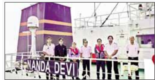
वडीनार बंदरगाह पर पहुंचा 'नंदा देवी' जहाज

एलपीजी आपूर्ति स्थिर होने की उम्मीद होर्मुज स्ट्रेट से 'नंदा देवी' जहाज भी भारत पहुंचा