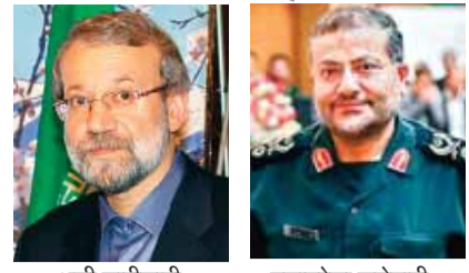
अली लारीजानी गुलामरेजा सुलेमानी