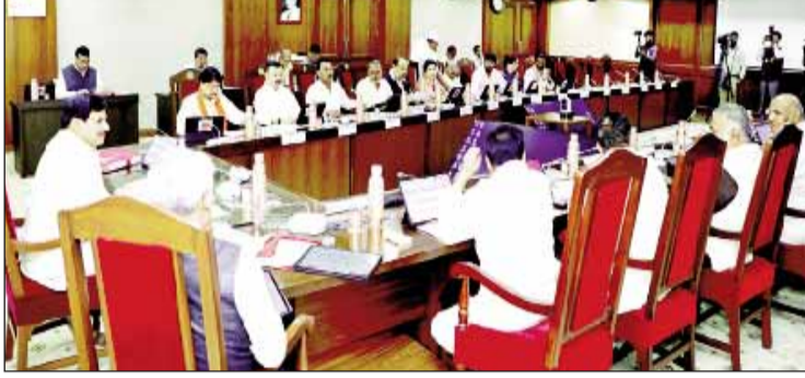
कैबिनेट बैठक में सीएम और मंत्रिमण

मंत्रालय के ठीक सामने स्थित सतपुड़ा भवन में आग लगने की घटना के बाद अब रेनोवेशन चल रहा है। करीब तीन साल पहले अचानक आग लगने से इस भवन का तीन मंजिल तक जलकर खाक हो गया था। बाद में इसे नए सिरे से डिस्टेंस कर निर्माण कराने से लेकर रेनोवेशन तक के लिए अलग-अलग योजनाएं बनीं। अंततः सरकार ने सारे एस्टीमेट को रिजेक्ट कर रेनोवेशन कराने का निर्णय लिया है। इस पर काम भी चल रहा है।