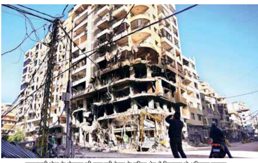
इजराइली सेना के लेबनान की राजधानी बेरुत के दहिया क्षेत्र में मिसाइल से क्षतिग्रस्त इमारत

सुलेमानी पर कई ईरानी नागरिकों की हत्या का आरोप