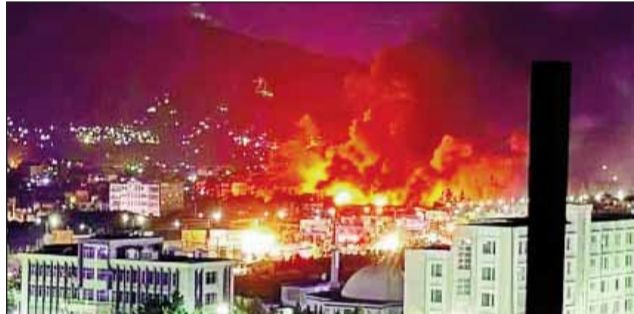
एयर स्ट्राइक के बाद काबुल का अस्पताल तबाह हो गया

तालिबान ने कहा- अब बातचीत नहीं पाकिस्तान को उसकी भाषा में जवाब दिया जाएगा