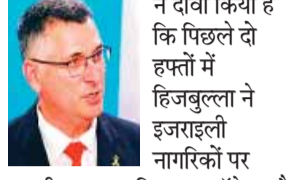
इजराइल के विदेश मंत्री गिदोन सार

इजराइल के विदेश मंत्री गिदोन सार ने दावा किया है कि पिछले दो हफ्तों में हिजबुल्ला ने इजराइली नागरिकों पर करीब 2,000 मिसाइल, रॉकेट और ड्रोन से हमले किए हैं। यह हमले बिना किसी उकसावे के लेबनान की तरफ से किए गए। गिदोन सार ने कनाडा, फ्रांस, जर्मनी, इटली और ब्रिटेन के नेताओं द्वारा जारी संयुक्त बयान को हकीकत से दूर बताया। इन देशों ने अपने बयान में लेबनान में बढ़ती हिंसा पर चिंता जताई थी और सभी पक्षों से तनाव कम करने तथा बातचीत के जरिए समाधान निकालने की अपील की थी। साथ ही उन्होंने हिजबुल्ला के हमलों को निंदा करते हुए कहा कि नागरिकों और बुनियादी ढांचे को निशाना बनाना गलत है।